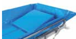
Trikotni vzglavnik / Triangle cushion