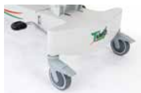
Kolesa s točkovno zavoro / Wheels with single break